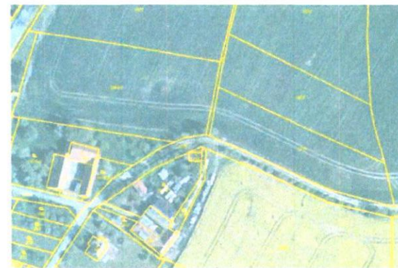
Ortofoto s obrazem katastrální mapy po obnově katastrálního operátu

Po skončení prací na obnově katastrálního operátu dochází k vyhlášení jeho platnosti. Podle § 62 odst. 2 katastrální vyhlášky (č. 26/2007 Sb.), zašle katastrální úřad sdělení o vyhlášení platnosti obnoveného katastrálního operátu obci, na jejímž území byl katastrální operát obnoven. Vyhlášení platnosti zveřejní katastrální úřad v součinnosti s obcí podle § 62 odst. 3 katastrální vyhlášky. Katastrální úřad a Český úřad zeměměřický a katastrální zveřejní vyhlášení platnosti obnoveného katastrálního operátu rovněž na svých internetových stránkách.