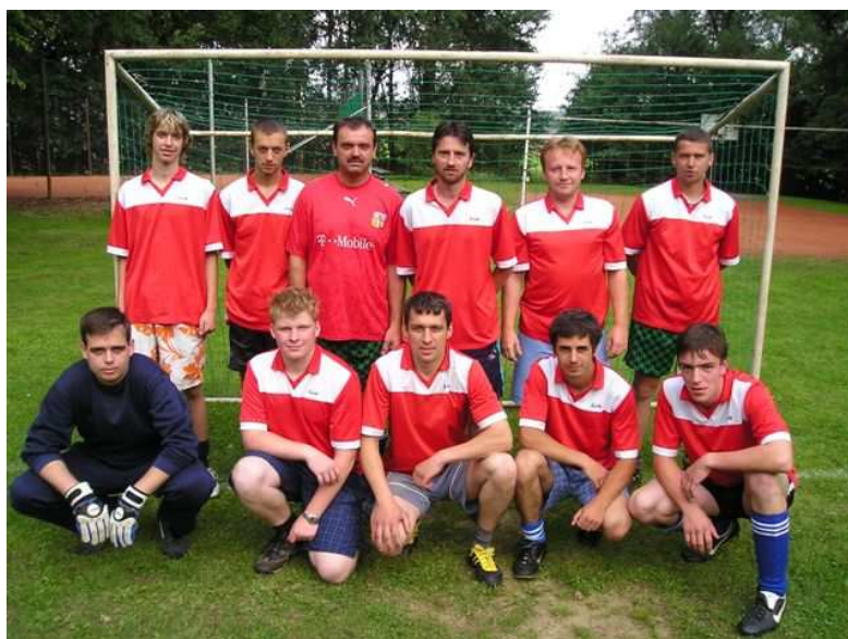
Na snímku jsou hráči Jupiteru Javorník – další javorničtí hráči hráli v družstvech Westvaco, Lazaret a KOBOKO