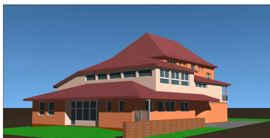
Pohled na budoucí objekt – východní pohled