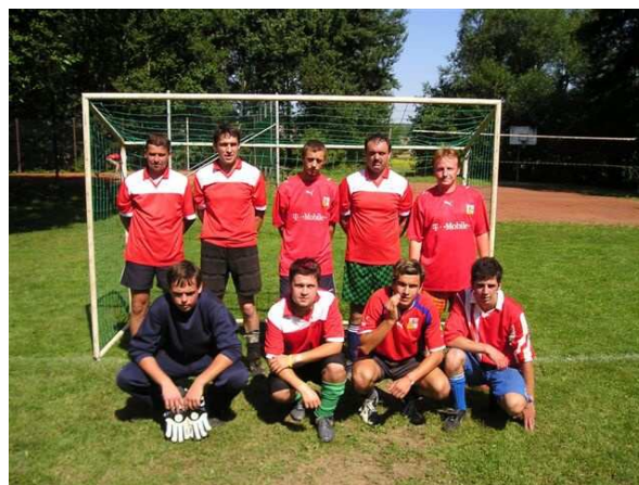
Na fotografii je družstvo Jupiter Javorník, které tentokrát na „bednu“ nedosáhlo – skončilo čtvrté. Snad příště...