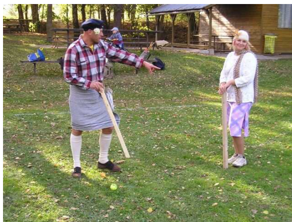
Snímek z I. ročníku Golf cupu (8.10.2005)

Konkrétní termíny budou včas zveřejněny pomocí letáků a zpráv SMS, které rozesílá obecní úřad. Komise termíny vyhlásí dle příznivých předpovědí počasí.