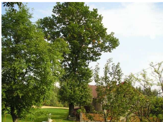
Víte, které místo v Javorníku je na snímku?

Stromy zpevňují půdu. To dobře věděli už naši předkové, proto na hráze rybníků sázeli duby a proto také vysazovali stromořadí podél cest.