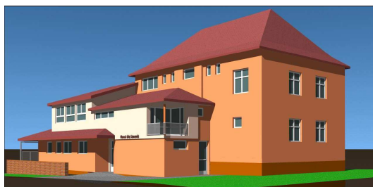
Pohled na budoucí objekt – severní pohled